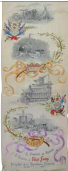
欧州リボンの見本