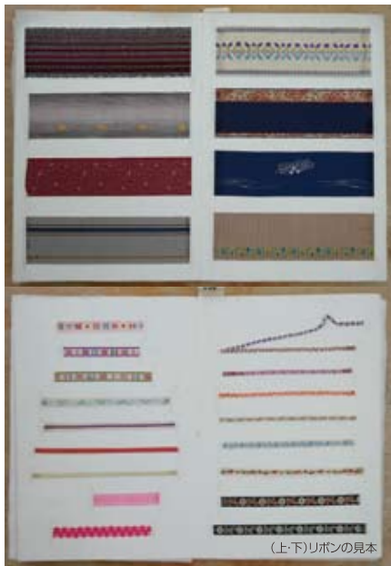
(上・下)リボンの見本