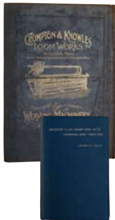
(下右)リボン製造関連の洋書