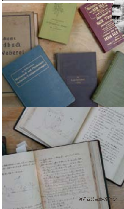
渡辺四郎自筆の研究ノート