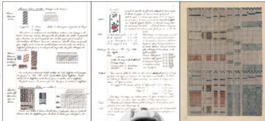
渡辺四郎自筆のノート(デザイン織り方図)